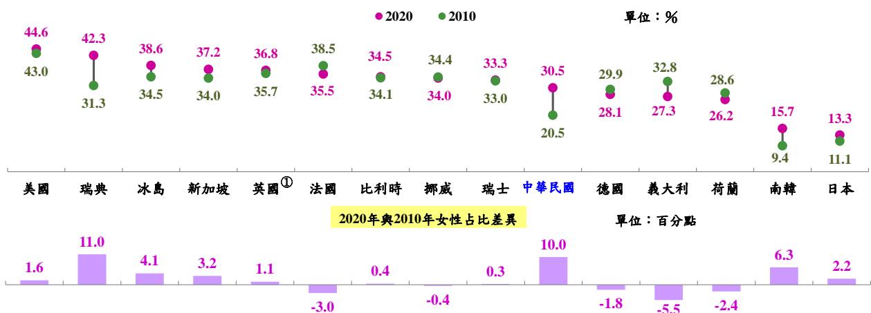
2020 年我國與主要國家民意代表、主管及經理人員女性占比

二、觀察各主要國家女性民意代表、主管及經理人員占比，大多低於男性，2020 年（109 年）以美國 44.6% 較高，我國 30.5% 則低於歐美主要國家，惟高於亞鄰國家南韓（15.7%）及日本（13.3%）；另與 2010 年相較，女性占比以瑞典提高 11.0 個百分點最多，其次為我國增 10.0 個百分點，南韓及日本亦分別增 6.3 個百分點及增 2.2 個百分點，減少的國家中，以義大利減 5.5 個百分點最多，其次為法國減 3.0 個百分點。