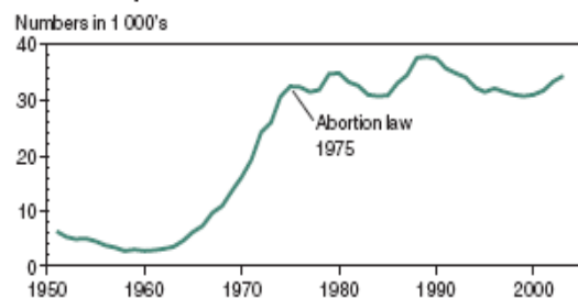
Abortions performed 1951–2003