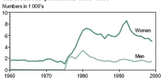
Sterilisations performed 1960–1999