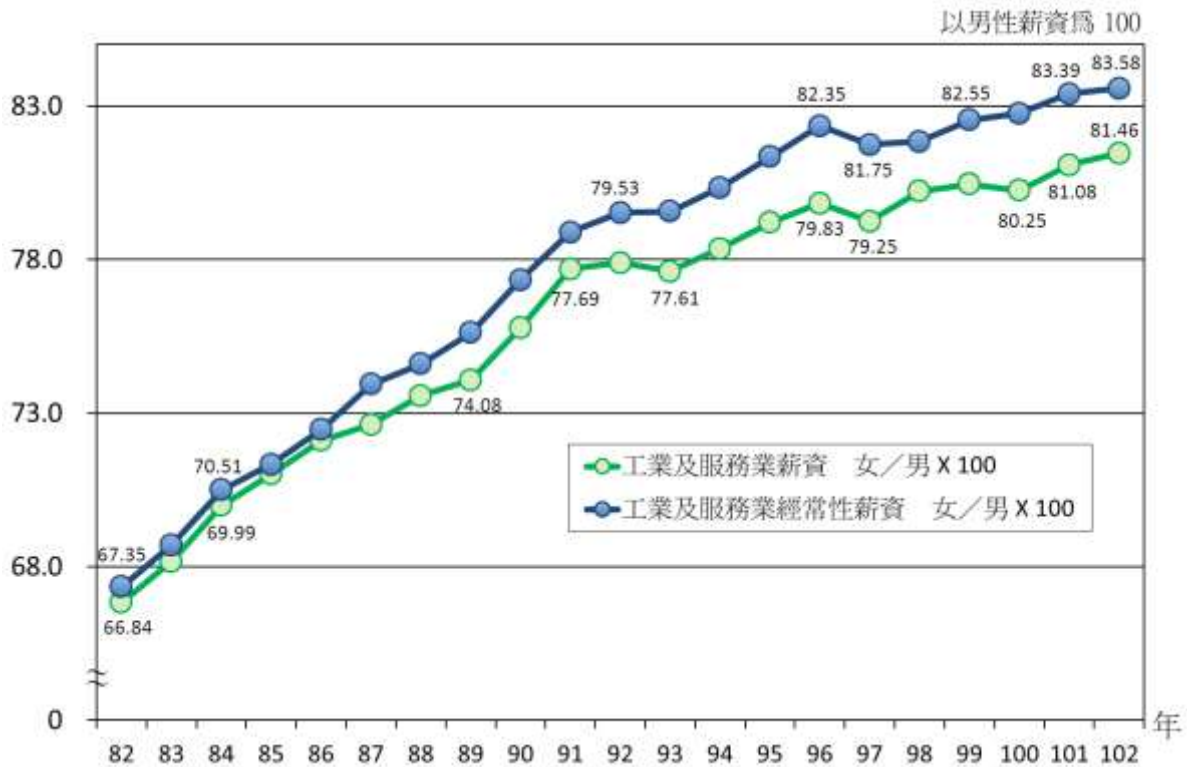
圖2 女性受僱員工薪資相對男性薪資之比例